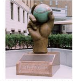
日本野球発祥の地モニュメント 2003年、東京神田の学生会館(開成学校があった場所)に建立された。

1945年(昭和20) 1946年(昭和21) 1947年(昭和22) 1948年(昭和23) 1949年(昭和24) 1950年(昭和25) 1951年(昭和26) 1952年(昭和27) 1953年(昭和28) 1954年(昭和29) 1955年(昭和30) 1956年(昭和31) 1957年(昭和32) 1958年(昭和33) 1959年(昭和34) 1960年(昭和35) 1961年(昭和36) 1962年(昭和37) 1963年(昭和38) 1964年(昭和39) 1965年(昭和40) 戦後の復興、2リーグ制が始まる。戦後の復興、2リーグ制が始まる。