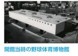
開館当時の野球体育博物館

2021年(令和元) 2022年(令和元) 2023年(令和元) 東京オリンピック決勝戦。東京オリンピック決勝戦。